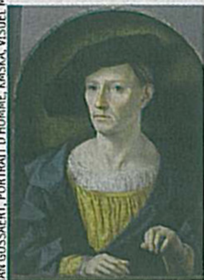
IAN GOSSAERT, PORTRAIT D'HOMME, KMSKA, VISUEL MMA NEW YORK